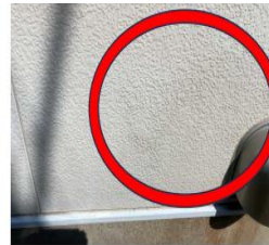
ナノゾーンコート施工面