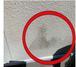
ナノゾーンコートなし